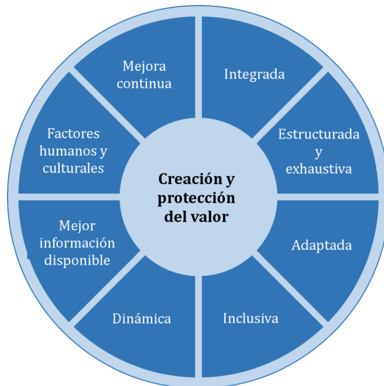
Figura 2 — Principios

Los principios descritos en la Figura 2 proporcionan orientación sobre las características de una gestión del riesgo eficaz y eficiente, comunicando su valor y explicando su intención y propósito. Los principios son el fundamento de la gestión del riesgo y se deberían considerar cuando se establece el marco de referencia y los procesos de la gestión del riesgo de la organización. Estos principios deberían habilitar a la organización para gestionar los efectos de la incertidumbre sobre sus objetivos.