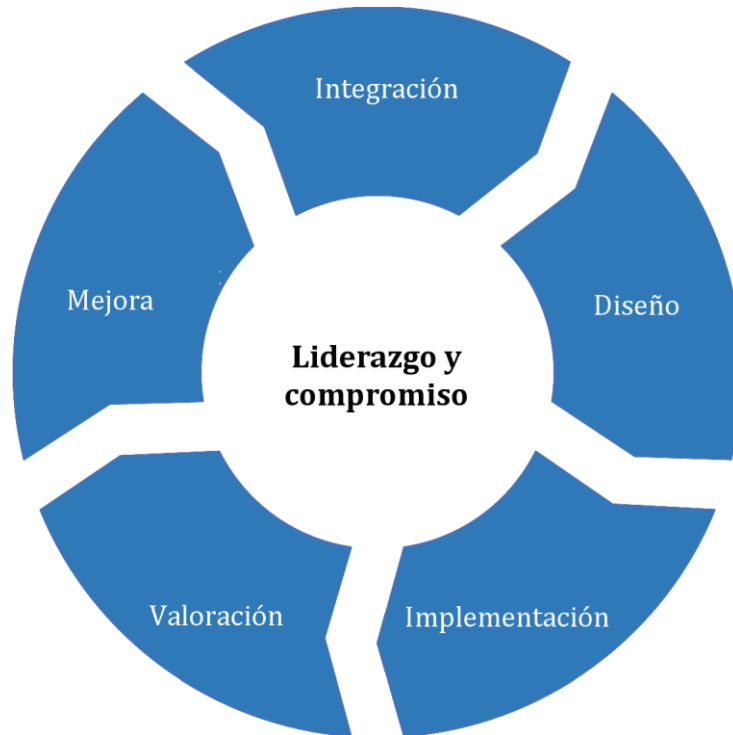
Figura 3 — Marco de referencia

La organización debería valorar sus prácticas y procesos existentes de la gestión del riesgo, valorar cualquier brecha y abordar estas brechas en el marco de referencia.